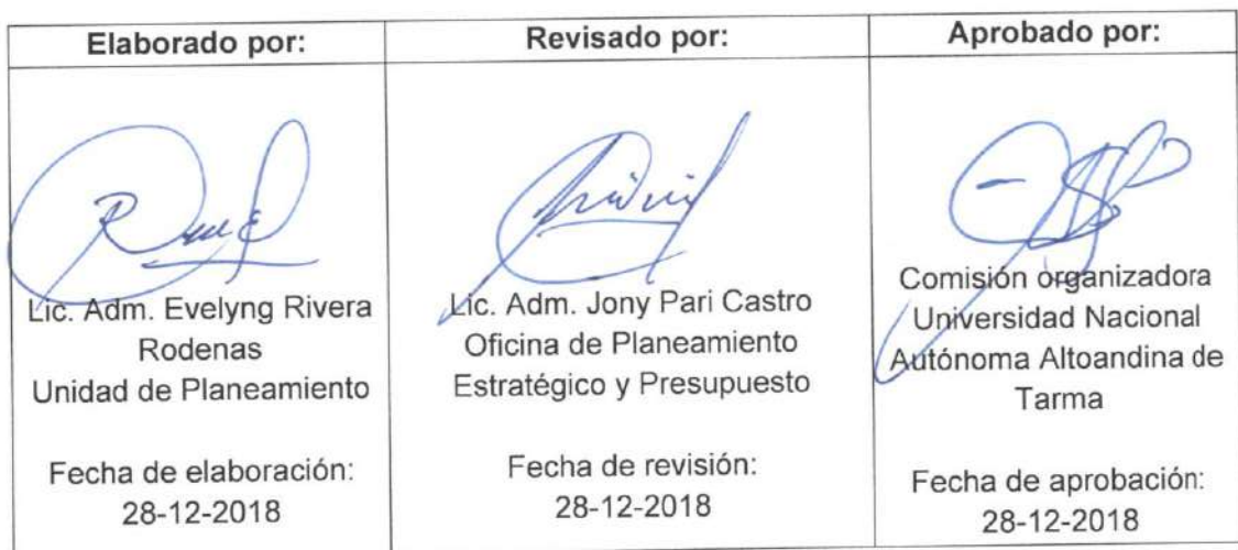
TABLA DE APROBACIÓN DEL DOCUMENTO

La impresión o copia de este documento adquiere el estado de "DOCUMENTO NO CONTROLADO"