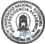
TABLA DE APROBACIÓN DEL DOCUMENTO